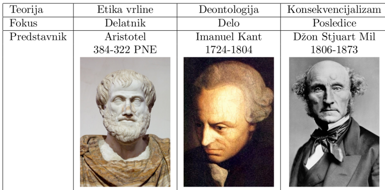
Tabela 1: Pregled teorija etike i vrednosti koje zastupaju (Slike preuzete sa sajta Wikipedia )