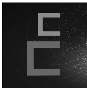
Slika 6: Belgrade Crypto Community logo

Termini kriptovaluta, blokčejn, majner, digitalni novčanik i bitcoin su od svog nastanka zaintrigirali i dobili pažnju ne samo IT scene, već i javnosti. Belgrade Crypto Community je organizacija sa ciljem da ovu tematiku popularizuje i prenese svoje znanje na što veći broj ljudi.