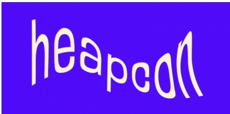
Slika 1: Heapcon logo

Heapcon je konferencija posvećena softver inženjerima i biznisima koji se bave informacionim tehnologijama. Iza ove konferencije stoji neprofitna organizacija iz Beograda heapSPACE koja od 2004. godine radi na razvoju lokalnih i regionalnih IT biznisa kroz deljenje znanja.