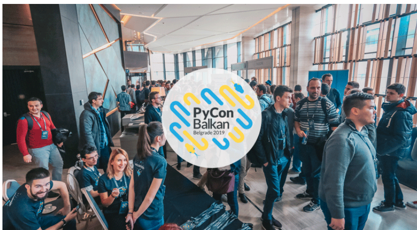
Slika 2: Pycon Balkan konferencija

PyCon Balkan je konferencija koja se održava jednom godišnje na Balkanu sa ciljem da omogući sastajanje kako inženjera tako i internacionalnih i regionalnih kompanija. Neke od kompanija koje stoje iza ove konferencije su Kortechs, ICT Hub, Django, Python Software Foundation, Startit, Packt, Matematički fakultet.