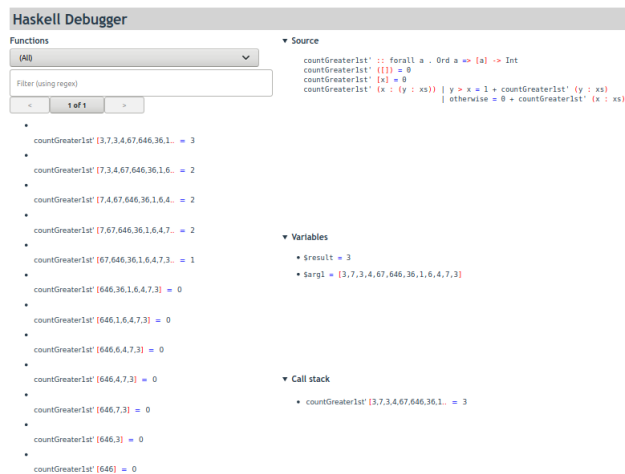
Slika 3: Prozor Debug-a nakon primene countGreater1st'