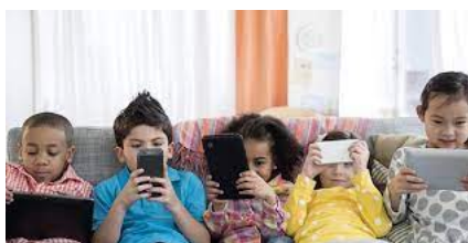
Slika 4: Izloženost dece internetu od ranog detinjstva

između zavisnosti od interneta i zavisnosti od društvenih medija i nekih psiholoških karakteristika koje mogu uticati na nastanak poremećaja kao što su strah od propuštanja (FOMO) i emocionalne poremećenosti. Uzet je uzorak od 598 studenata španskog univerziteta prosečne starosti 22 godine. Rezultati su pokazali da su pozitivna veza između zavisnosti od interneta i društvenih mreža sa osobinama kao što su neraspoloženost, tuga i emocionalna nestabilnost. Takođe, rezultati su pokazali da postoji negativna veza između zavisnosti od interneta i osobina kao što su odgovornost i organizovanost[9].