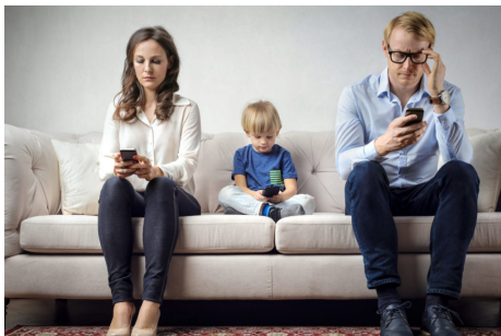
Slika 3: Odsustvo roditelja u kontrolisanju sadržaja kom je dete izloženo na internetu

Dodatno, izazovi vezani za pritisak stvaranja idealizovane slike stvarnosti na društvenim mrežama često dovode do nerealnih očekivanja i narušavaju samopouzdanje dece. Kao primer toga, navešćemo sve veće i češće promovisanje kocke, kladenja, raznih rijaliti programa i još mnogo programa ovakvog karaktera koji za cilj imaju stvaranje iskrivljene slike realnosti i pravih životnih vrednosti. Kroz komunikaciju i postavljanje realnih standarda, roditelji mogu pomoći deci da razviju realističan pogled na svet oko sebe i usmeravati ih i odvrćati od praćenja ovakvog sadržaja.